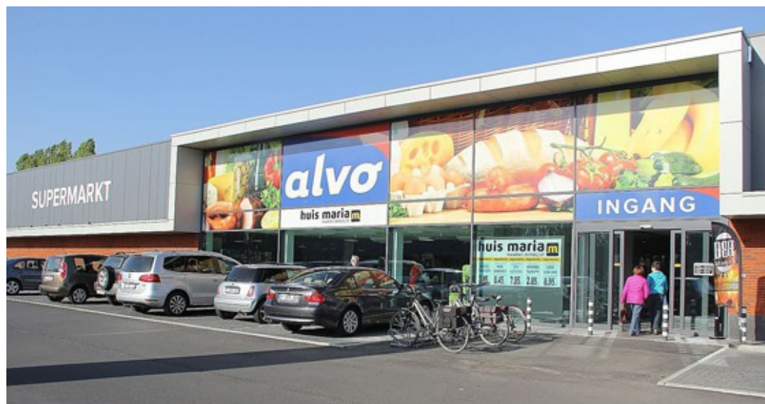
Huis Maria in Hulste is een uit de kluiten gewassen buurtwinkel die zich zowel richt op zelfbediening als op bediening. De Huis Maria supermarkten staan vooral bekend om het grote aanbod verswaren